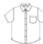
Chemise bleu ciel unie à manches courtes