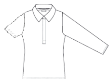
Polo à manches longues ou courtes bleu ciel uni