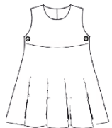
Chasuble ou jupe-short bleu marine modèle imposé*