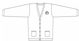
Cardigan / Gilet-tirette bleu marine modèle imposé