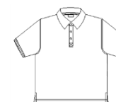
Polo bleu ciel uni à manches courtes