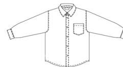
Chemise bleu ciel unie à manches longues