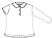
Polo à manches longues ou courtes, bleu ciel uni