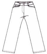
Pantalon classique bleu marine uni* (Ni caleçon, ni jeans)