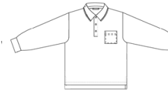
Polo bleu ciel uni à manches longues