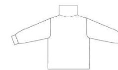
Sous-pull bleu ciel uni