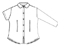
Chemisier à manches longues ou courtes bleu ciel uni