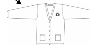
Cardigan / gilet tirette bleu marine modèle imposé