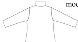
Sous-pull bleu ciel uni