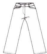
Pantalon classique, bleu marine uni* (Ni caleçon, ni jeans)