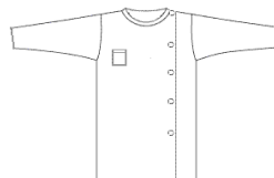
Tablier au modèle imposé (bleu, rouge, vert)