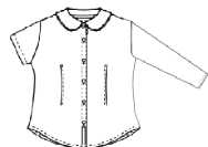
Chemisier à manches longues ou courtes, bleu ciel uni