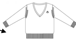
Pull bleu marine encolure V modèle imposé