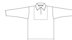
Tablier OBLIGATOIRE pour les 1res et 2es années (bleu, rouge, vert)